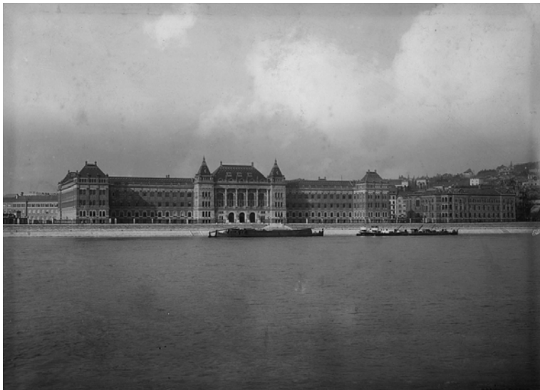
A Budapesti Műszaki Egyetem központi épülete 1909 körül